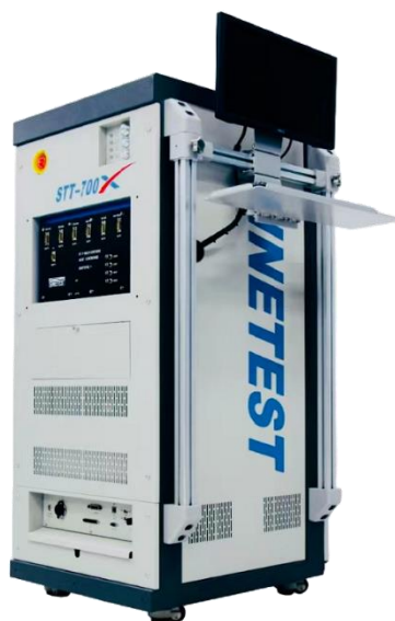
双工位测试方案配置如下表