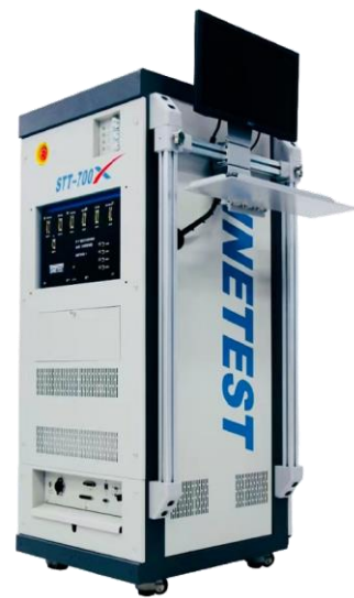
4 sites test configurations: